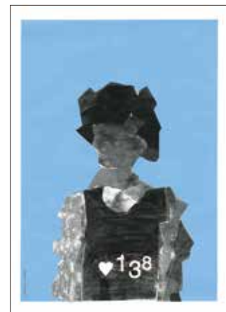
青柳萌々 東京工芸大学 Like