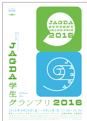
デザイン：居山浩二