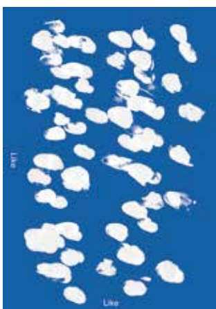
岸田紘之 専門学校 桑沢デザイン研究所 the motion of a thumb