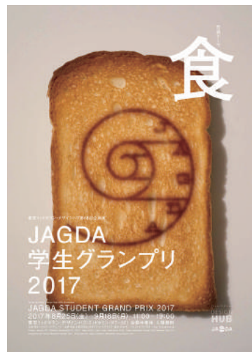
展覧会ヴィジュアル (デザイン：居山浩二)