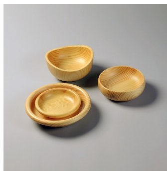
大野木工(給食器ほか)