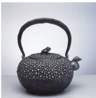
岩手県工業技術センター秘蔵鉄器 「親子形霰丸形鉄瓶」

内 容 [グッドデザイン賞受賞デザイン展示] 株式会社岩鑄プロ・アルテシリーズ/株式会社東光舎 ヘキサゴン鑄子シリーズ/てまるプロジェクト 介護食器てまる [いわての工芸展示] 岩手県工業技術センター秘蔵鉄器/南部鉄器協同組合青年部新作鉄器/壱鑄堂/岩手県内漆器工房(安比塗、秀衡塗、浄法寺漆器)/大野木工(給食器ほか)/県内工房作品 [復興祈念酒「オールいわて清酒」展示および無料試飲会(※試飲会は24日(土)夜のみ・未成年者参加不可)]