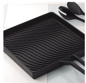
株式会社岩鑄 プロ・アルテシリーズ