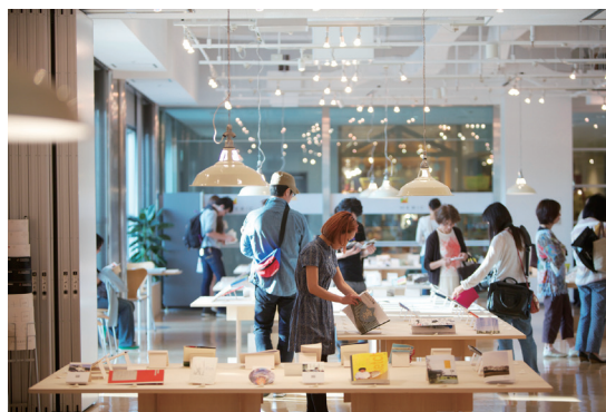
2013年大阪での出展の様子