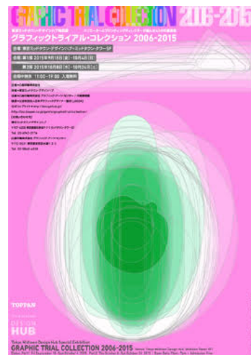
公式ビジュアル(デザイン:勝井三雄)

公式ウェブサイト http://biz.toppan.co.jp/gainfo/graphictrial/collection/