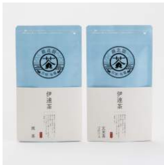
商品：伊達茶(煎茶・玄米茶) [(株)矢部園茶舗/宮城] デザイン：河野久美子 [DIC カラーデザイン(株)/東京]