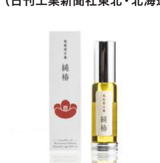
商品：純つばき油 [椿屋本舗(合)/宮城] デザイン：釣瓶昂右 [多摩美術大学/東京]