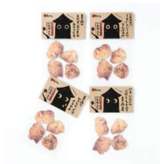
商品：イカメンチ揚げ [(株)丸石沼田商店/青森] デザイン：阿部拓也 [凸版印刷(株)/宮城]