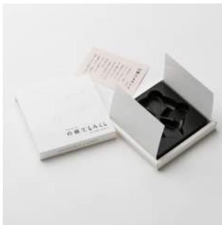
商品：プレミアム生もろこし(金粉入り) [(株)唐土庵いさみや/秋田] デザイン：高橋真一 [(株)オフィスオフサイド/東京]