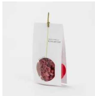
商品：サクランボパスタ [(有)玉谷製麺所/山形] デザイン：永嶋邦子 [(株)ティ・ティ・エス/東京]