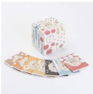
商品：南部せんべい詰合せ [(有)志賀煎餅/岩手] デザイン：高橋純也 [ネモグラフィック/岩手]