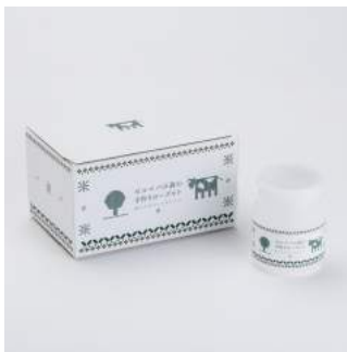
商品：酪農家の手作りヨーグルト [(株)ゼルコパドリーム/宮城] デザイン：主演景子 [川口印刷工業(株)/東京]