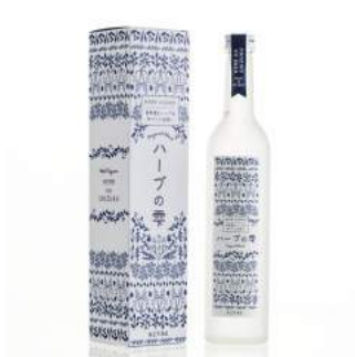
商品：ハーブ酒 [笹正宗酒造(株)/福島] デザイン：山里美紀子 [(株)パムローカルメディア/沖縄]