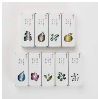
商品：漁師赤間謹製 しおがまの藻塩 宮城の香り藻塩9種類 [(株)シーフーズあかま/宮城] デザイン：山内 渉 [専門学校日本デザイナー芸術学院 仙台校/宮城]