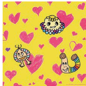
石田徳芳 | 東京 カミジヨウミカ | 長野