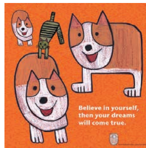
子鬼 | 神奈川 尾崎文彦 | 東京