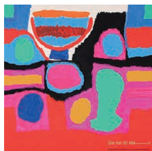
山本俊治 | 広島 吉川明広 | 高知