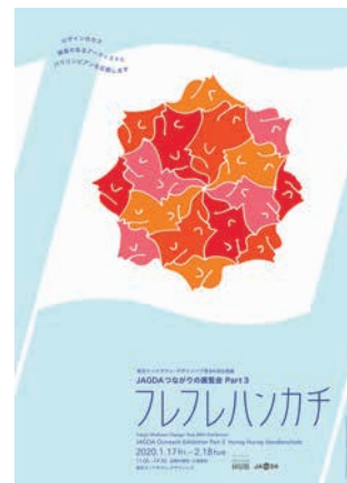
メインビジュアル デザイン：左合ひとみ アート：seyyamizu