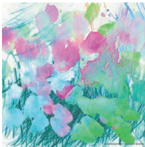
白本由佳 | 東京 宮本憲史朗 | 神奈川