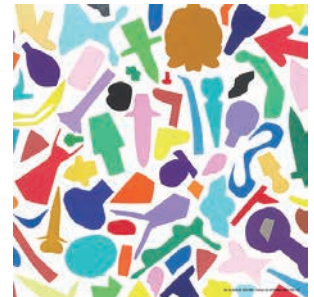
橋本謙次郎 | 石川 輪島 楓(*) | 石川