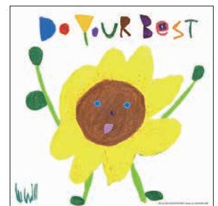
金 宰弘 | 韓国 西ノ園有紀 | 奈良