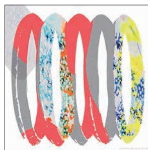
Kimi Tang | オーストラリア 清井了支 | 神奈川