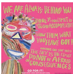
細川誠明 | 大阪 いそべRYO | 神奈川