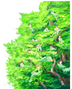
作品名/やがて光に

大阪府出身。大阪芸術大学美術学科卒。1983年「ハローフレンド」(講談社)に掲載の『はあとビビッとさしみインコ』でデビュー。『死と彼女とぼく』、『死と彼女とぼく ゆかり』ほか『海の砂漠』シリーズなど著書多数。